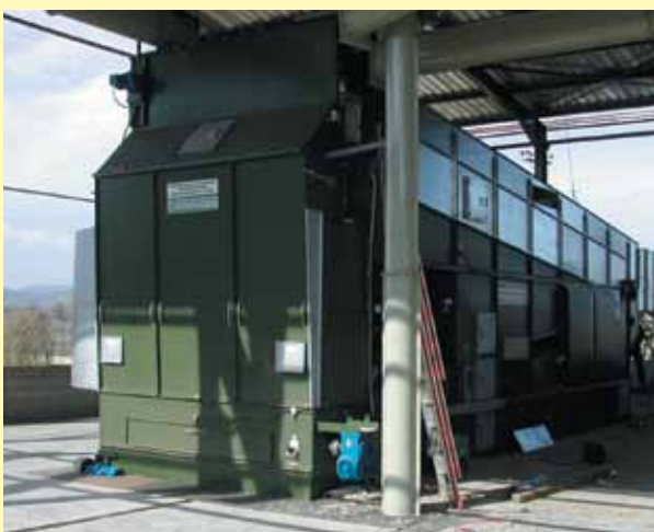
Семя хлопчатника в Греции