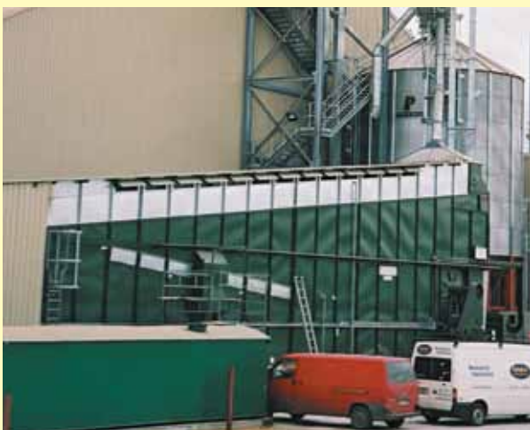
Овес в Ирландии