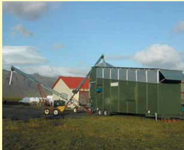
Семя масличного рапса