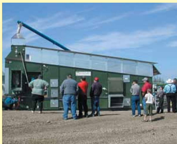
Пшеница в Канаде

AB ALVAN BLANCH Processing the World's Crops