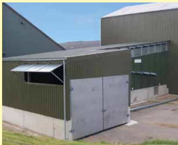
Ячмень пивоваренный в Шотландии