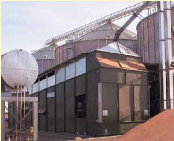
Маис в Саудовской Аравии